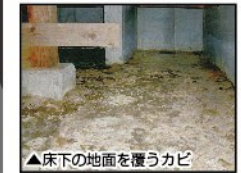
▲床下の地面を覆うカビ

ジメジメした床下にカビが発生! 湿った床下は、木部はもちろん地面にもカビが発生してしまいます。木部が腐り、悪臭の原因にもなります。